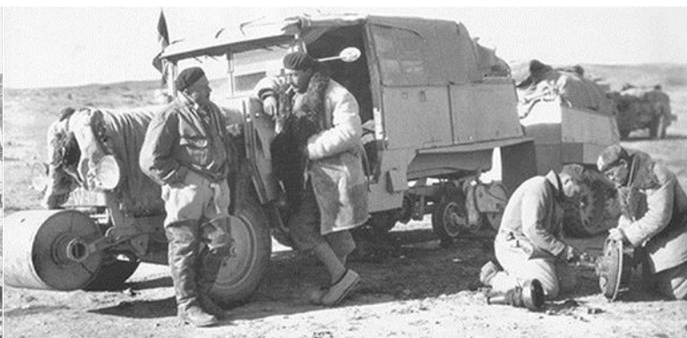
dans le désert de Gobi