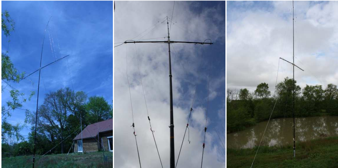
à gauche, la VDA 20m-17-15m, au centre et à droite , la VDA 10m-12m

« je te joins quelques photos de la préparation des antennes HF pour l'expédition merci pour les annonces chaque semaine, 73 Didier F6BCW »