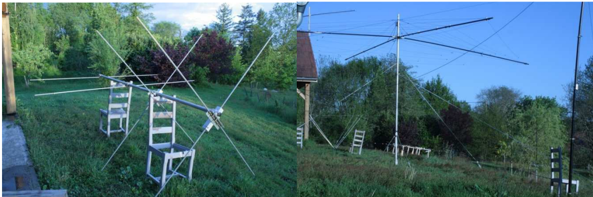
à gauche la Quagi 6m, à droite la SpiderBeam en essai