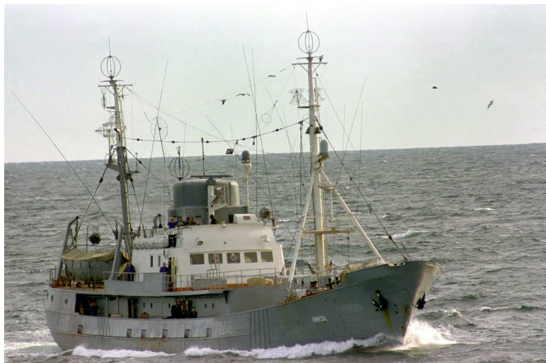
une station d'écoute radio en mer, du Service de Renseignement Soviétique en 1986

« Pylônes radioamateurs, un guide pour la conception, l'installation et la construction ».