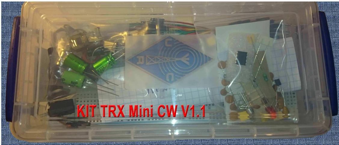
KIT TRX Mini CW V1.1